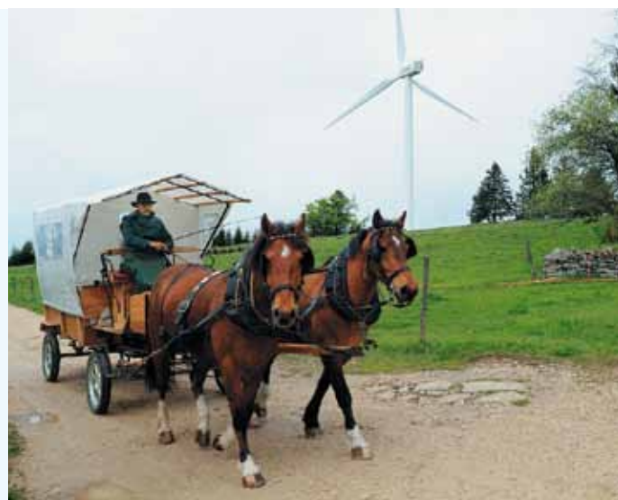
Mit der Kutsche gehts von Windrad zu Windrad.