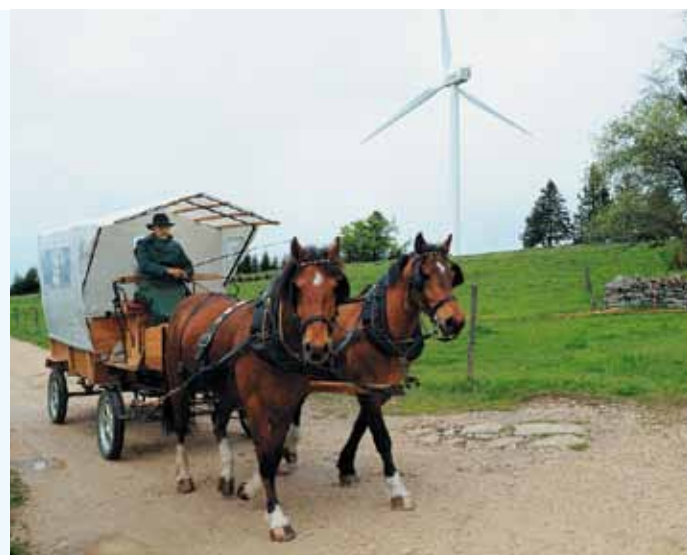
Un char attelé vous emmènera d'éolienne en éolienne.

satisfait. Pour lui, le fonds écologique est un succès. Il cite des chiffres: 3 millions de CHF du fonds de FMB ainsi que 3 millions supplémentaires donnés par des tiers ont été utilisés pour rendre à l'Aar sa beauté d'autrefois. Cependant, «il reste encore beaucoup à faire, des centaines de kilomètres de cours d'eau peuvent encore être revalorisés», affirme Jürg von Orelli de l'Inspection cantonale de la pêche, membre du comité de direction. Outre les mesures de renaturation de l'Aar, il pense aussi à ses affluents et aux ruisseaux qui coulent aujourd'hui dans des conduites