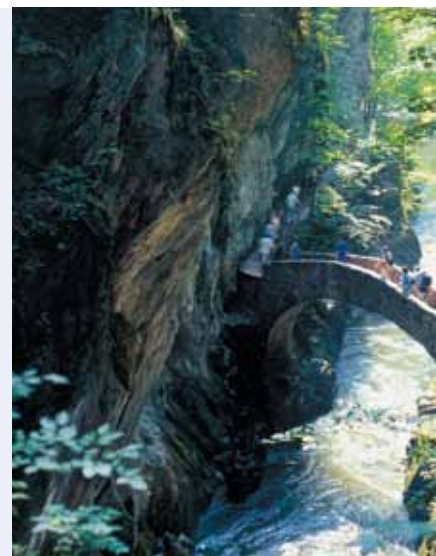
Une petite centrale sera construite au

Si tout se passe comme prévu, la petite centrale hydroélectrique pourra être mise en service en 2012 et fournir en électricité quelque 480 foyers.