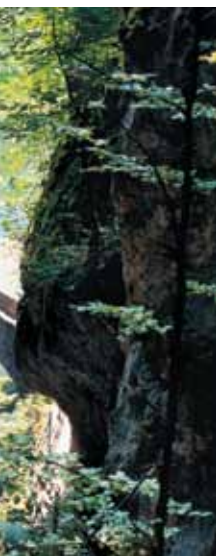
bord de l'Areuse.