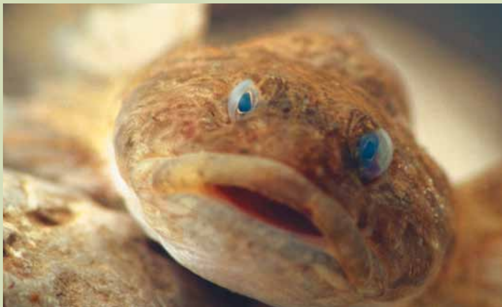
Le chabot est à nouveau chez lui grâce à la renaturation de l'Isar.

En 1988, le Conseil municipal a décidé d'agir. Avec le «Plan Isar», la rivière devait retrouver son ancienne apparence, naturelle, sur une longueur de huit kilomètres. Il s'agissait également d'améliorer la protection contre les inondations et l'aspect loisirs en supprimant les barrages, en élargissant le lit du fleuve et en faisant de l'Isar un espace naturel en pleine ville. La renaturation devait coûter à la ville, soutenue par le ministère de l'Environnement, près de 30 millions d'euros. La réussite du plan Isar doit aussi beaucoup au soutien des associations de protection de la nature, des pêcheurs et du secteur du tourisme.