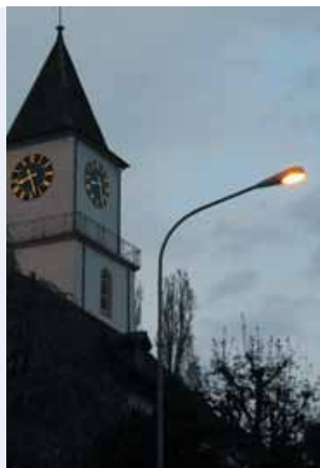
Täuffelen: Strassenbeleuchtung mit Ökostrom aus Aarberg.

Die Gemeinde Täuffelen beleuchtet ihre Strassen seit Jahresbeginn mit Ökostrom, der mit dem Label «naturemade star» zertifiziert ist. Sie will die Bevölkerung dazu anregen, ebenfalls Strom aus erneuerbaren Energien zu beziehen. Für den Ökofonds der BKW bedeuten die bestellten 180 000 kWh einen Zustupf von 1800 Franken. Sie fließen in Renaturierungsprojekte rund um das Wasserkraftwerk Aarberg (siehe Haupttext).