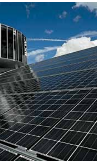
f dem Stade de Suisse.

Es würde mich sehr freuen, bis 2020 den Lachs wieder ins Seeland holen zu können. Hierzu brauchen wir verschiedene Massnahmen, vor allem Steighilfen.