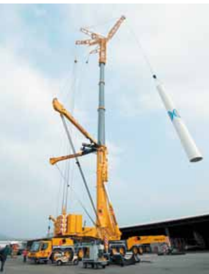
Der mächtige Teleskopkran.

Pro Kilowattstunde «1to1 energy water star»-Ökostrom, die in «naturemade star»-zertifizierten Wasserkraftwerken mit einer Leistung von mindestens 100 kW produziert wird, fliesst 1 Rappen in einen Fonds. Mit dem Geld werden ökologische Aufwertungsmassnahmen rund um entsprechend zertifizierte Kraftwerke finanziert. Ein bereits realisiertes Projekt ist beispielsweise dieser Fischpass beim Wasserkraftwerk Aarberg.