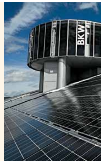
«Soleil», die Infoplattform auf dem Stadiondach.