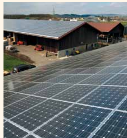
Die Solaranlage in Ittigen.