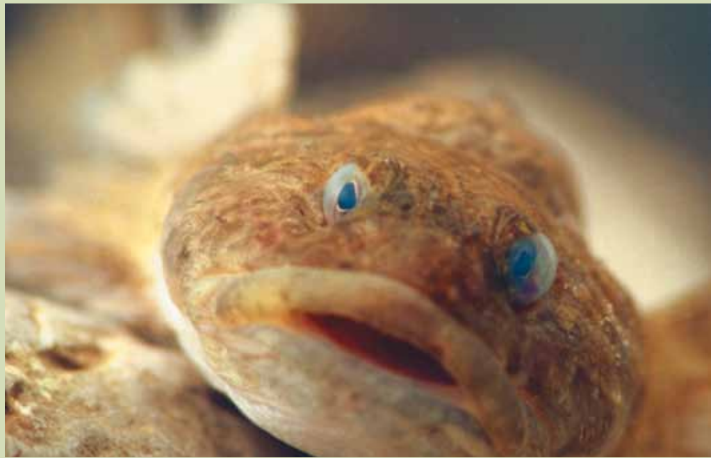
Die Groppe fühlt sich dank der Renaturierung in der Isar wieder wohl.

1988 schickte sich der Stadtrat an, dies zu ändern. Er lancierte den «Isarplan», der dem Fluss auf einer Länge von acht Kilometern sein altes, natürliches Gesicht zurückgeben sollte. Gleichzeitig wollte man Hochwasserschutz und Freizeitwert verbessern. Dämme sollten zurückgebaut, das Flussbett verbreitert und die Isar im Stadtzentrum ein naturnaher Raum werden. Die Renaturierung sollte die Stadt München mit Unterstützung des Umweltministeriums rund 30 Millionen Euro kosten. Der Isarplan fruchtete, nicht zuletzt weil die Naturschutzverbände, die Fischerverbände und die Tourismusbranche das Projekt unterstützten.